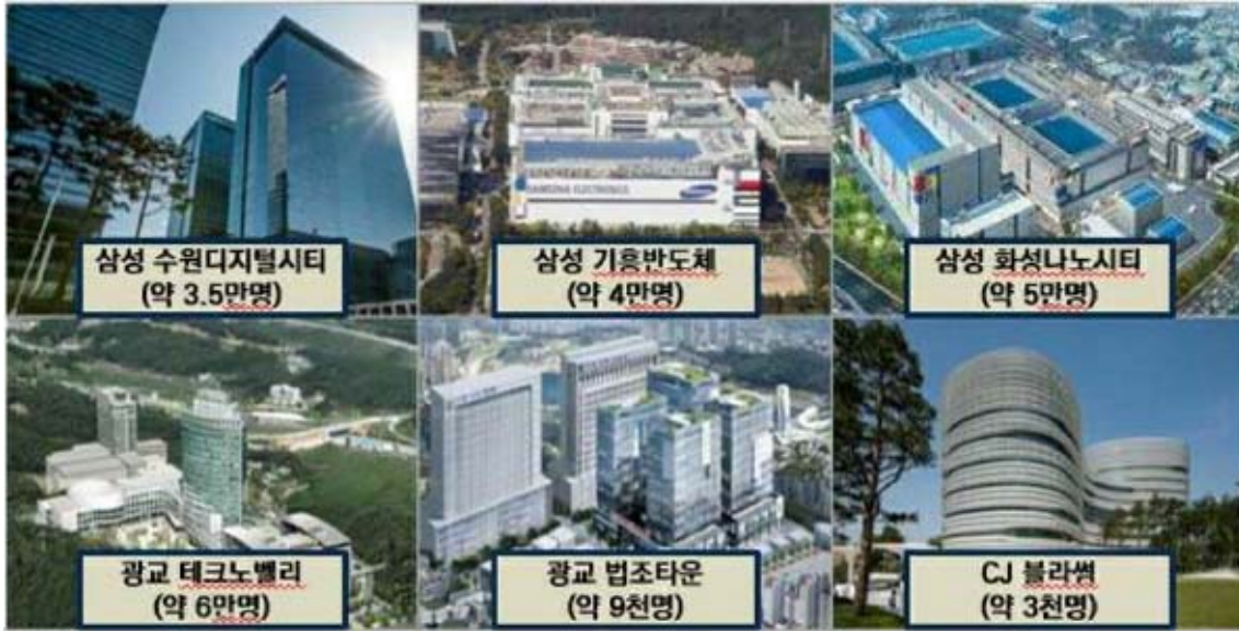
공급현황 및 예상수요