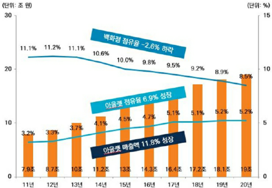
점유율 추이 및 전망

출처: Deloitte 광고센터얼푸르지오시티 상업시설 Information Memorandum