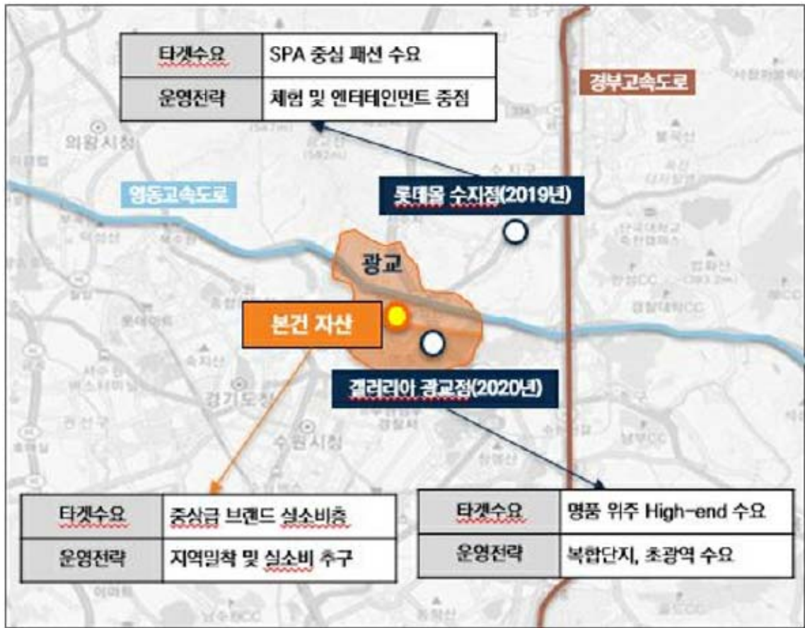
수요 및 전략